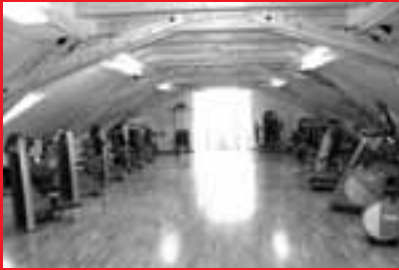
Corporate Wellness SVM-Fitnesscenter