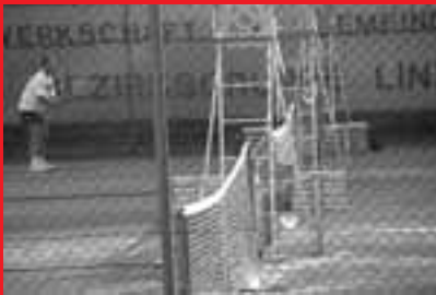
Tennismatch online buchen